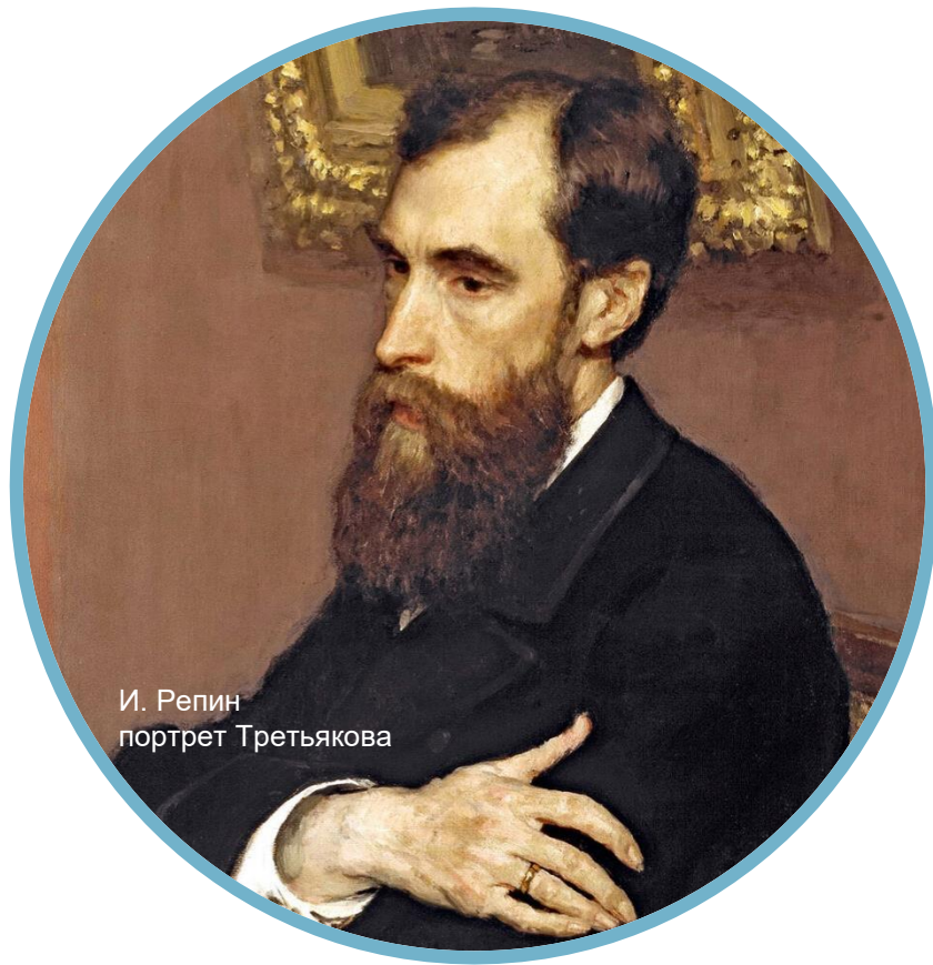
И. Репин портрет Тургенева